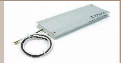
Der 200-Watt-Bremswiderstand der Michael Koch GmbH.

Die Datenblätter der Michael Koch GmbH machen auf einfache aber eindrückliche Weise deutlich, welche faszinierenden Möglichkeiten sich mit dieser neuen Technologie für die Technische Dokumentation eröffnen. Die einzige Voraussetzung ist der Einsatz des Acrobat Reader ab Version 7. Dann kann es mit der 3. Dimension losgehen: In einem mehrseitigen Datenblatt im PDF-Format mit einer Größe von weit weniger als 100 KB ist eine interaktive Darstellung des Widerstands enthalten, die man an die eigenen Präferenzen auch noch anpassen kann: Eine Zoomfunktion beweist, dass das Produkt auch bei einem hohen Faktor noch immer hoch aufgelöst dargestellt wird. Die Darstellungsform ist frei wählbar: Neben der gefüllten Kontur, die dem echten Produkt am nächsten kommt, werden noch 14 weitere Darstellungsarten wie Drahtmodell, gefülltes Drahtmodell oder