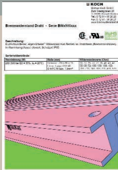
PDF-Datenblatt mit 3D-Darstellung eines 200-Watt-Bremswiderstands der Michael Koch GmbH: Auch eher grelle Darstellungen sind möglich.

Das CAD-Modell kann mit dem Werkzeug Adobe Acrobat 3D eingelesen und dabei in das U3D-Format umgewandelt werden. Dieses Werkzeug ist seit Februar 2006 auf dem Markt und kann den überwiegenden Teil aller 3D-Formate konvertieren. Mit Acrobat 3D ist es möglich, 3D-Modelle in eine schon vorhandene PDF-Datei mit beliebigem Inhalt zu integrieren und dort zu positionieren. Wird dieses Dokument dann im PDF-Format gespeichert, kann das Format mit dem Acrobat Reader, ab Version 7.0, mit voller 3D-Funktionalität dargestellt und in einer sehr guten Qualität gedruckt werden. Mit Acrobat 3D besteht außerdem die Möglichkeit, 3D-Modelle in die Programme der Office-Familie zu integrieren. Vielversprechend sind die Möglichkeiten der Animation mit dem Acrobat 3D Toolkit und den Interaktionen und Erweiterungen, die mit Javascript programmiert werden können. Dadurch können Texte mit dem 3D-Modell in Beziehung gebracht werden. Zum Beispiel könnte eine 3D-Demontageanimation eines Verschleißteils durch das Klicken auf den entsprechenden Text in der PDF-Datei ausgeführt werden.