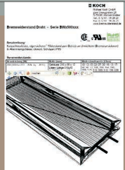
Der 200-Watt-Bremswiderstand der Michael Koch GmbH in Drahtdarstellung. Auch erkennbar ist die Werkzeuggeste, die sehr verschiedene Einstellungen ermöglicht.

Bei Adobe steht das Werkzeug Acrobat 3D im Zentrum. Mit ihm kann fast jedes Datenformat von CAD-Systemen und Animationsprogrammen in das benötigte U3D-Format konvertiert werden. Über einen OpenGL Capture können 3D-Daten auch direkt aus der Grafikkarte gelesen und in PDF integriert werden. Für die Gestaltung und die Animation der 3D-Modelle stellt Adobe mit Acrobat 3D und dem Acrobat-3D-Toolkit eine umfangreiche Werkzeugpalette zur Verfügung.